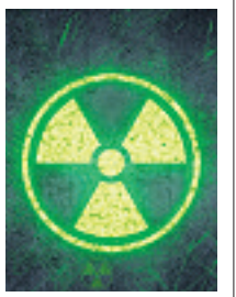
De bijeenkomst is vanaf 25 januari te beluisteren op TXRadio.